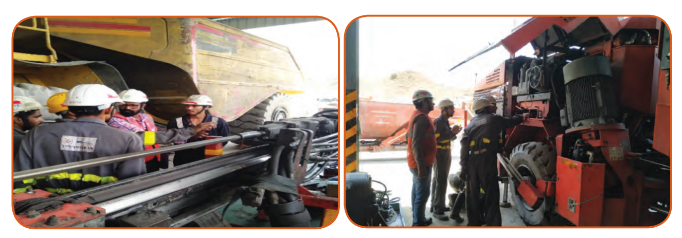
SCMS-HZMA Trainees during Assessment

The candidates who do not qualify in this evaluation process shall continue to carry on with the more hands on practice on the equipment and shall re-appear for the assessment in the month of December, 2019.