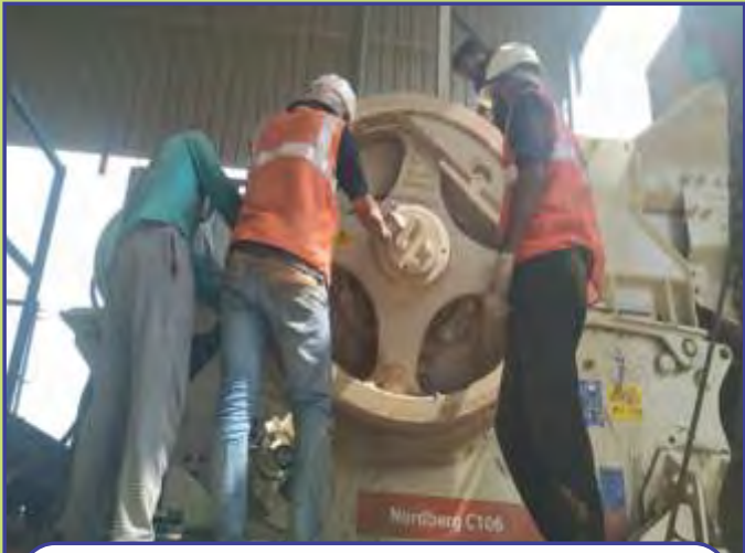
Onsite Ore Processing Operator Training

Courses We Offer Under PMKVY - We offer training under PMKVY Scheme in all job roles of SCMS