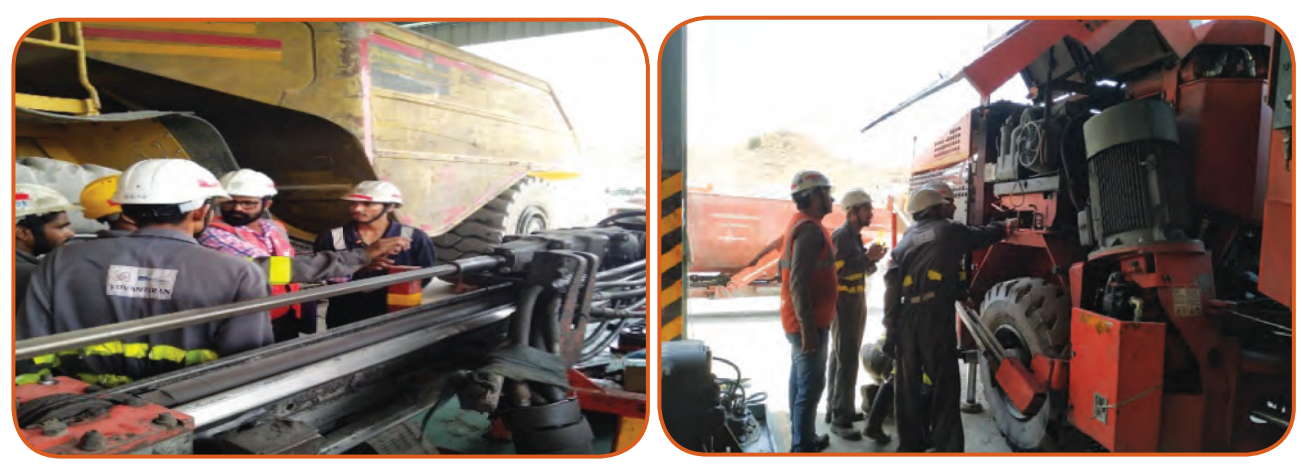
मूल्यांकन के दौरान एस.सी.एम.एस–एच.जेड.एम.ए प्रशिक्षु

जो प्रतिभागी इस मूल्यांकन प्रक्रियां में सफल नहीं हो पाते हैं वे उपकरण पर अभ्यास जारी रखेंगे एवं उन्हें दिसंबर, 2019 में मूल्यांकन के लिए पुनः उपस्थित होना होगा।